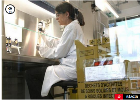
ARCHIVES. L'épidémie pourrait durer environ six semaines avec un pic attendu d'ici à trois ou quatre semaines.

Partager 5.8k Twitter 238 3-1 7 Share 0 Plus